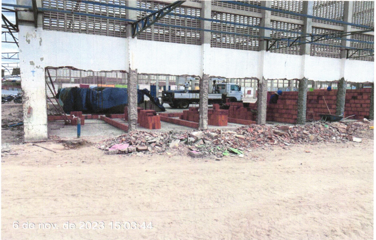
FOTO 14 - ALVENARIA DE VEDAÇÃO DE BLOCOS CERÂMICOS FURADOS NA HORIZONTAL DE 9X19X19CM (ESPESSURA 9CM) DE PAREDES COM ÁREA LÍQUIDA MAIOR OU IGUAL A 6M² SEM VÃOS E ARGAMASSA E ASSENTAMENTO COM PREPARO EM BETONEIRA. AF_06/2014.

FOTO 13 - ALVENARIA DE VEDAÇÃO DE BLOCOS CERÂMICOS FURADOS NA HORIZONTAL DE 9X19X19CM (ESPESSURA 9CM) DE PAREDES COM ÁREA LÍQUIDA MAIOR OU IGUAL A 6M² SEM VÃOS E ARGAMASSA E ASSENTAMENTO COM PREPARO EM BETONEIRA. AF_06/2014.