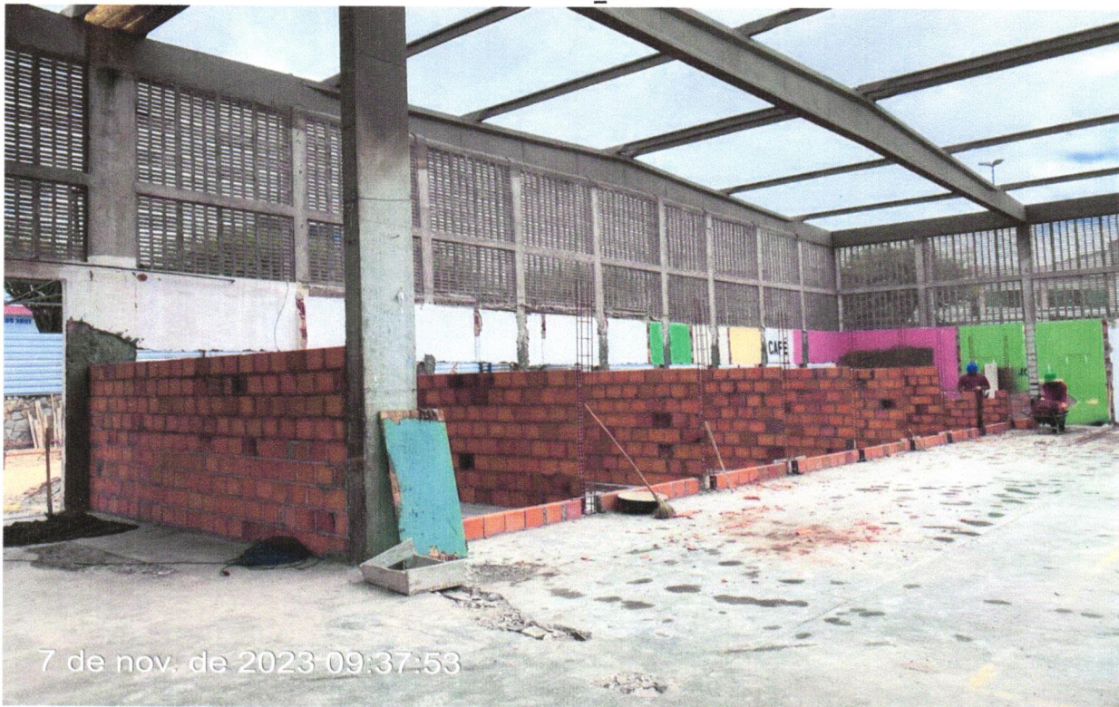
FOTO 08 - ALVENARIA DE VEDAÇÃO DE BLOCOS CERÂMICOS FURADOS NA HORIZONTAL DE 9X19X19CM (ESPESSURA 9CM) DE PAREDES COM ÁREA LÍQUIDA MAIOR OU IGUAL A 6M² SEM VÃOS E ARGAMASSA E ASSENTAMENTO COM PREPARO EM BETONEIRA. AF_06/2014.

FOTO 07 - ALVENARIA DE VEDAÇÃO DE BLOCOS CERÂMICOS FURADOS NA HORIZONTAL DE 9X19X19CM (ESPESSURA 9CM) DE PAREDES COM ÁREA LÍQUIDA MAIOR OU IGUAL A 6M² SEM VÃOS E ARGAMASSA E ASSENTAMENTO COM PREPARO EM BETONEIRA. AF_06/2014.