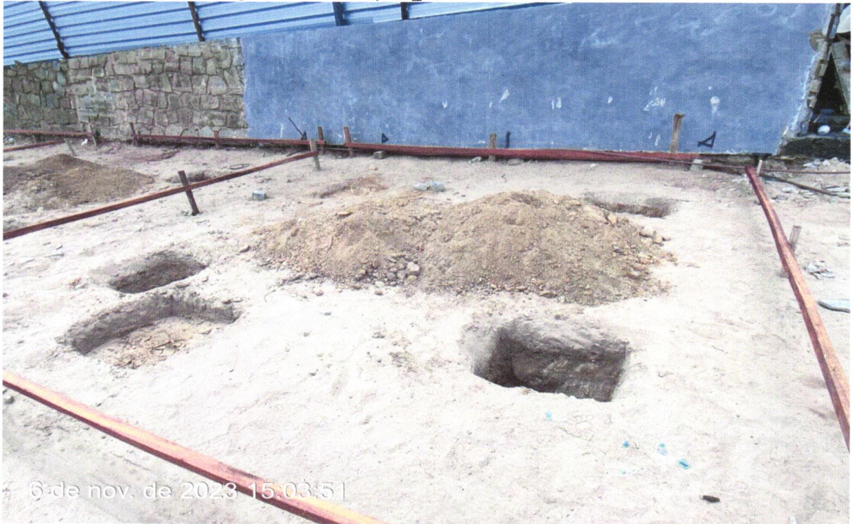
FOTO 22 - ESCAVAÇÃO MECANIZADA PARA VIGA BALDRAME COM MINI-ESCAVADEIRA (INCLUINDO ESCAVAÇÃO PARA COLOCAÇÃO DE FÔRMAS). AF_06/2017