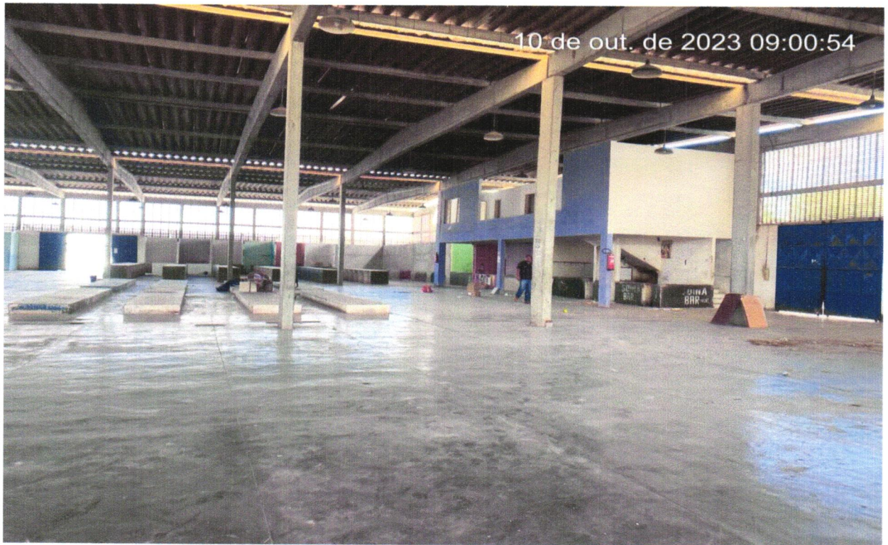
FOTO 04 - REMOÇÃO DE TELHAS, DE FIBROCIMENTO, METÁLICA E CERÂMICA, DE FORMA MANUAL, SEM REAPROVEITAMENTO. AF_12/2017.

FOTO 03 - REMOÇÃO DE TELHAS, DE FIBROCIMENTO, METÁLICA E CERÂMICA, DE FORMA MANUAL, SEM REAPROVEITAMENTO. AF_12/2017.