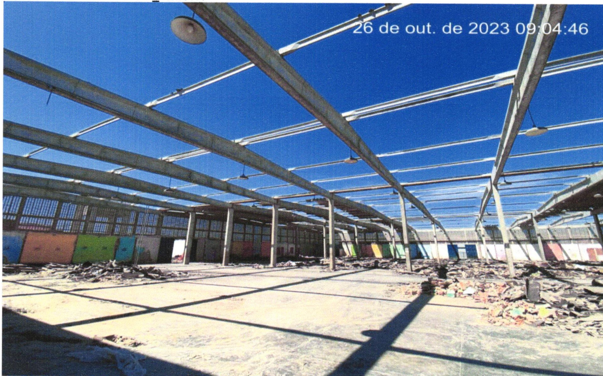
FOTO 06 - REMOÇÃO DE TELHAS, DE FIBROCIMENTO, METÁLICA E CERÂMICA, DE FORMA MANUAL, SEM REAPROVEITAMENTO. AF_12/2017.

FOTO 05 - REMOÇÃO DE TELHAS, DE FIBROCIMENTO, METÁLICA E CERÂMICA, DE FORMA MANUAL, SEM REAPROVEITAMENTO. AF_12/2017.