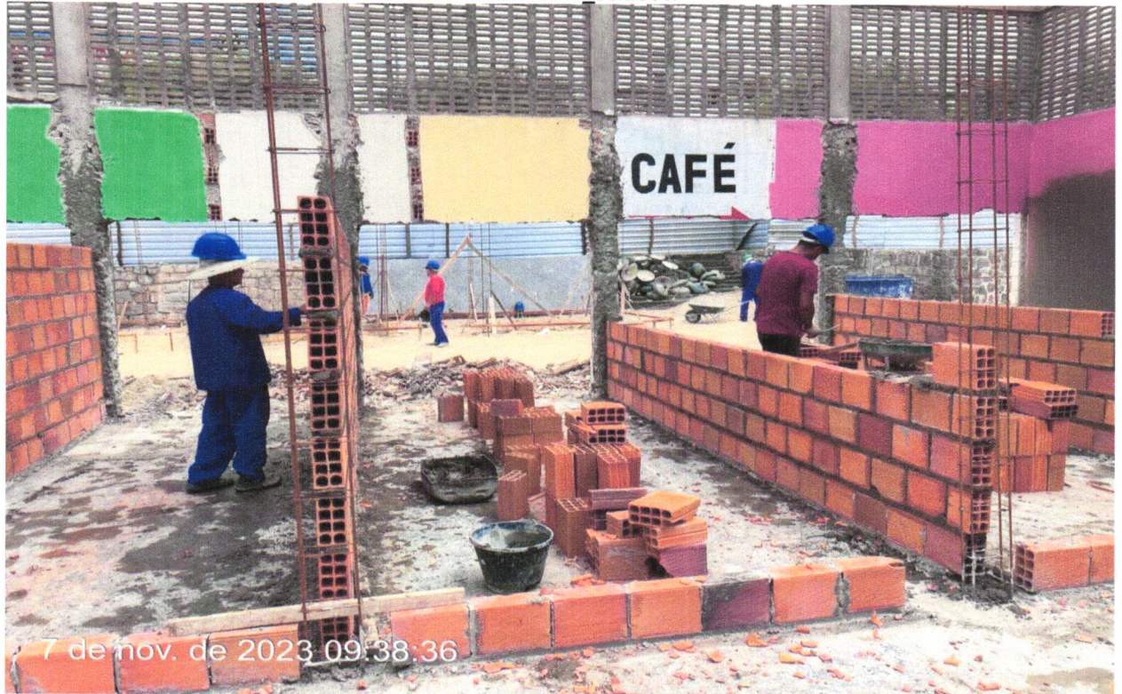
FOTO 10 - ALVENARIA DE VEDAÇÃO DE BLOCOS CERÂMICOS FURADOS NA HORIZONTAL DE 9X19X19CM (ESPESSURA 9CM) DE PAREDES COM ÁREA LÍQUIDA MAIOR OU IGUAL A 6M² SEM VÃOS E ARGAMASSA E ASSENTAMENTO COM PREPARO EM BETONEIRA. AF_06/2014.

FOTO 09 - ALVENARIA DE VEDAÇÃO DE BLOCOS CERÂMICOS FURADOS NA HORIZONTAL DE 9X19X19CM (ESPESSURA 9CM) DE PAREDES COM ÁREA LÍQUIDA MAIOR OU IGUAL A 6M² SEM VÃOS E ARGAMASSA E ASSENTAMENTO COM PREPARO EM BETONEIRA. AF_06/2014.