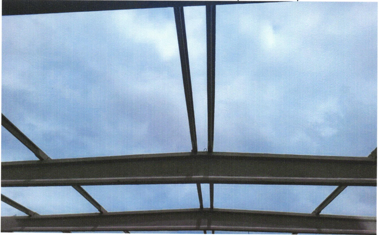
FOTO 20 - PINTURA COM TINTA ALQUÍDICA DE ACABAMENTO (ESMALTE SINTÉTICO ACETINADO) APLICADA A ROLO OU PINCEL SOBRE SUPERFÍCIES METÁLICAS (EXCETO PERFIL)