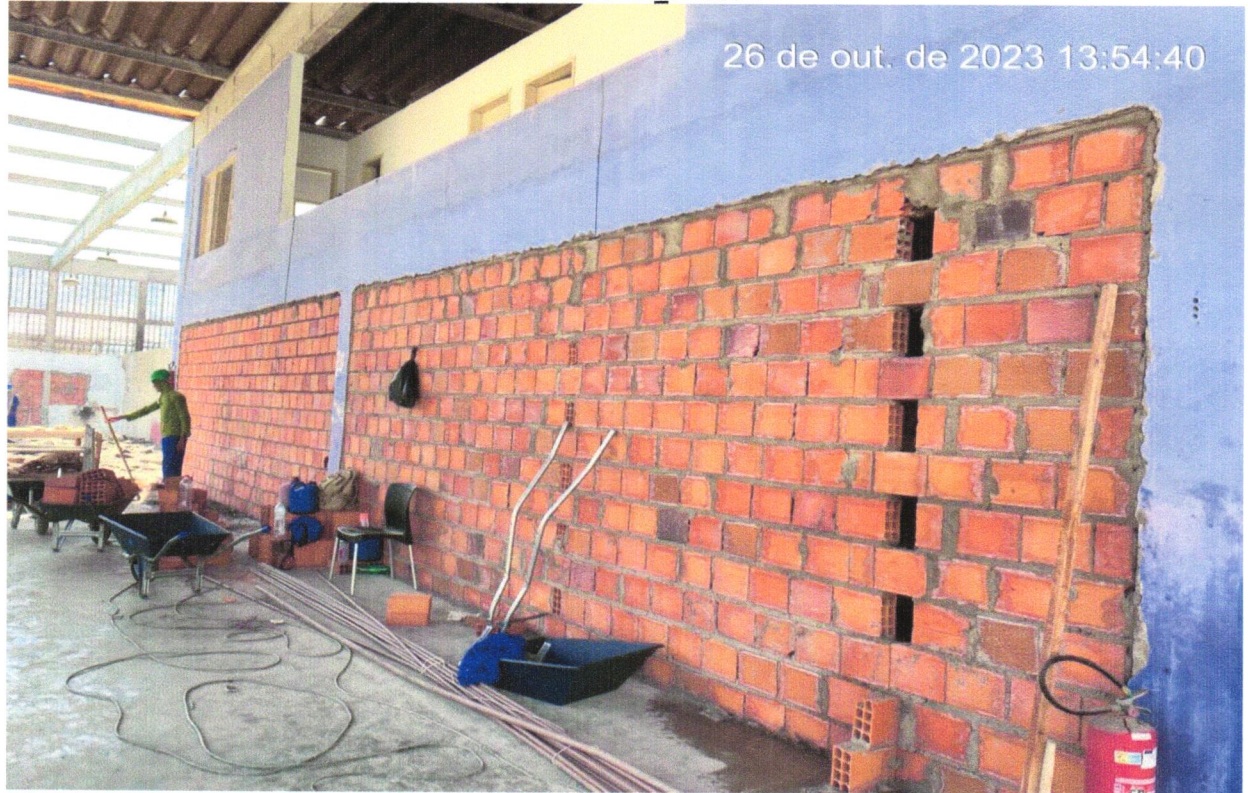
FOTO 12 - ALVENARIA DE VEDAÇÃO DE BLOCOS CERÂMICOS FURADOS NA HORIZONTAL DE 9X19X19CM (ESPESSURA 9CM) DE PAREDES COM ÁREA LÍQUIDA MAIOR OU IGUAL A 6M² SEM VÃOS E ARGAMASSA E ASSENTAMENTO COM PREPARO EM BETONEIRA. AF_06/2014.

FOTO 11 - ALVENARIA DE VEDAÇÃO DE BLOCOS CERÂMICOS FURADOS NA HORIZONTAL DE 9X19X19CM (ESPESSURA 9CM) DE PAREDES COM ÁREA LÍQUIDA MAIOR OU IGUAL A 6M² SEM VÃOS E ARGAMASSA E ASSENTAMENTO COM PREPARO EM BETONEIRA. AF_06/2014.